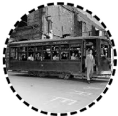
Antigua Tranvía de Medellín