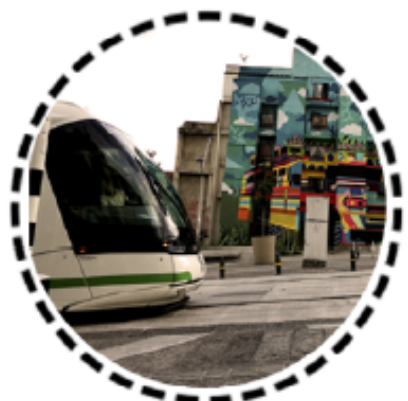
4. Estación Bicentenario Tranvía