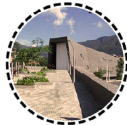
5. Museo de la Memoria