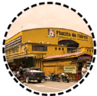
3. Placita de Flórez