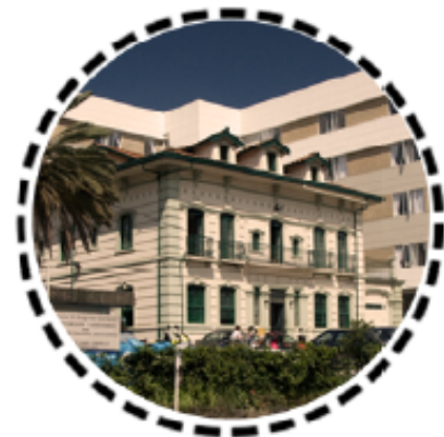
6. Clínica Sagrado Corazón