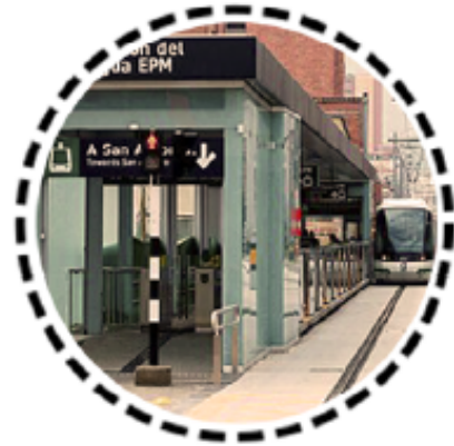
2. Estación Pabellón del agua / Tranvía